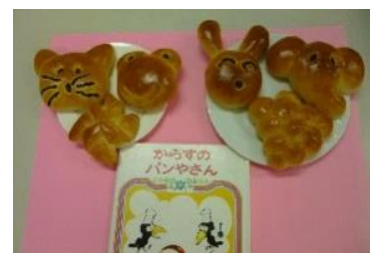
毎年好評のどうぶつパン

内容：「杉の子の家」が運営するパン販売所『きずな』と図書館のコラボ。毎回好評のどうぶつパンなどを販売します。