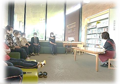
↑ 図書館の中で読み聞かせ ← 読み聞かせの後、七夕の短冊を飾りました

読書は心を豊かにしてくれます。それは、いくつになっても変わりません。ところが、年齢を重ねて「字が見えにくくなった」「図書館まで行く『足』がない」と、様々な理由で図書館から遠ざかる方もいらっしゃいます。そうした方に、少しでも図書館を身近に感じていただけるように、これからもサービスを提供していきます。