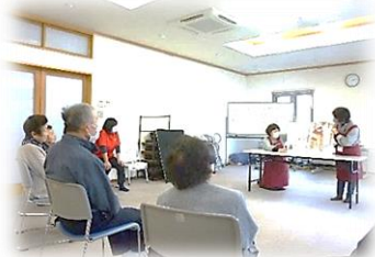
← なごみの家での読み聞かせ